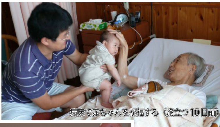
病床で赤ちゃんを祝福する(旅立つ10日前)