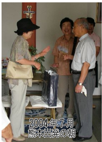
2004年7月 熊本出発の朝