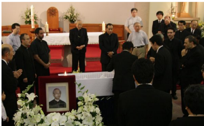
司祭団のサルベレジーナで送る

深堀司教は、「異邦人への宣教は、教区全体の司牧と愛の活動を統一し、収斂する原理となる」と言う教皇ヨハネ・パウロ二世の言葉に沿って、高松教区を二十七年間導いた。彼は、第二ヴァチカン公會議の精神に基づいて、復活したキリストの見える体を目指す中で、キリスト教入信と継続養成の必要性を直観した。彼は、新しい福音化を推進する為に、故田中英吉司教が導入した新求道期間の道を評価し、奨励すると共に、その「道」から宣教家族を招いたが、それらの夫婦と大勢の子供達の証を通して、多くの日本人がキリストを知る恵みを受けている。彼はまた、深刻な召命の不足を補う為に、ヨハネ・パウロ二世に強く励まされて、高松教区に教区立「レデンプロリス・マーテル」国際宣教神学院を設立した。現在、日本と世界各地で、この神学院で養成された三十人の司祭たちが宣教して