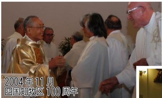
2004年11月 四国知牧区100周年