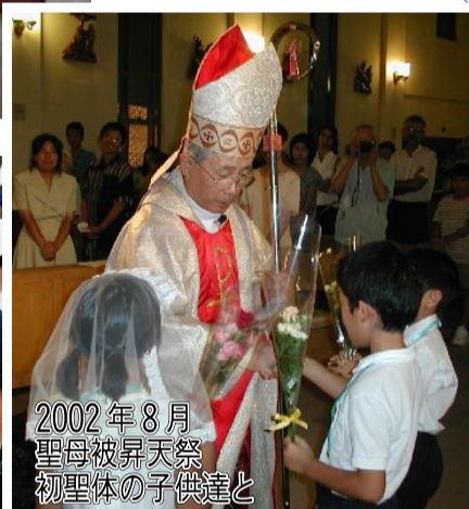
2002年8月 聖母被昇天祭 初聖体の子供達と