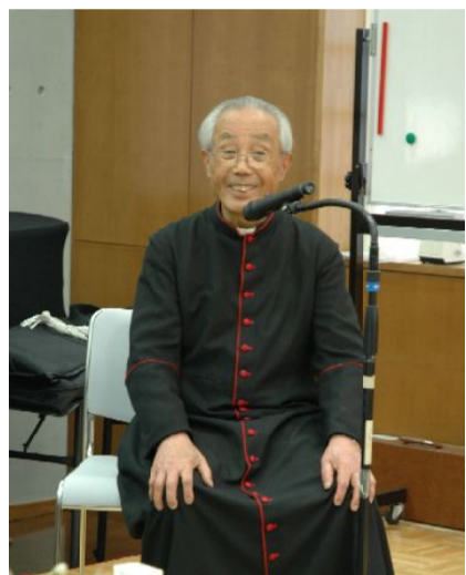
2009年4月 送別会 手取教会からショファイユの幼きイエズス修道会へ