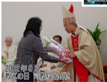
2002年9月 教区の日 司教叙階銀祝