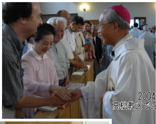
2004年7月 高松教区での最後の公式ミサ