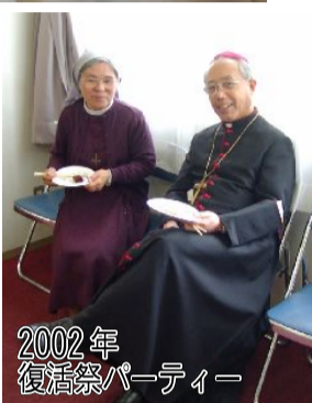
2002年 復活祭パーティー