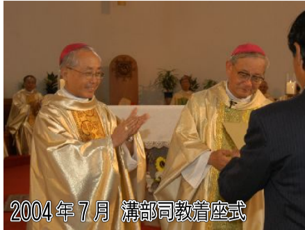
2004年7月 溝部司教着座式