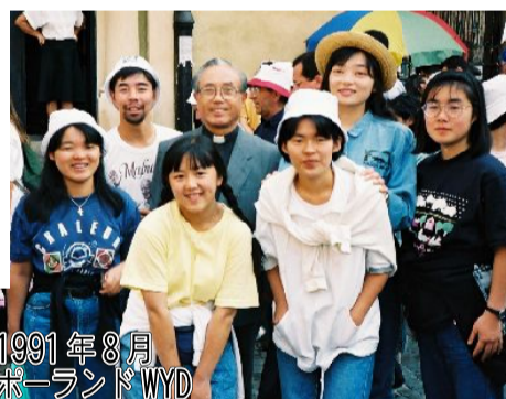
1991年8月 ポーランドWYD 教区の青年に囲まれ