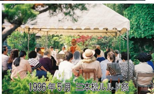
1996年5月 三本松ルルド祭