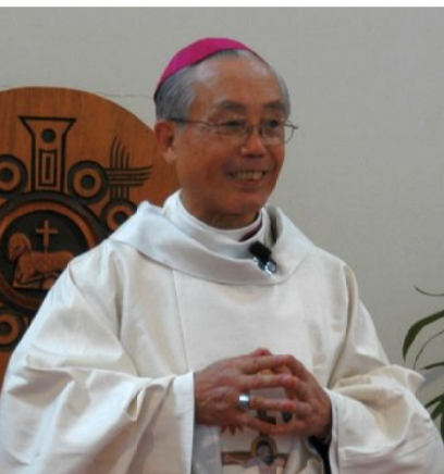
高松教区での最後の公式ミサにて

同司教の葬儀は、高松教区桜町司教座聖堂に於いて、二十六日午後六時通夜式に続き二十七日午後一時から教皇大使をはじめ各教区司教、修道会、司祭、親族、信徒ら五五〇人余りが参列し、しめやかな中にも莊嚴な葬儀ミサが執り行われた。高見三明長崎大司教が説教を行い、岩永神父の弔辞に続く溝部司教の喪主挨拶で締めくくられた。聖歌隊による聖歌の中、告別式には多くの信徒、関係者による献花の長蛇の列が続いた。最後に、参列した全司祭の「サルベージュナ」の斉唱に送り出されて葬儀を終えた。