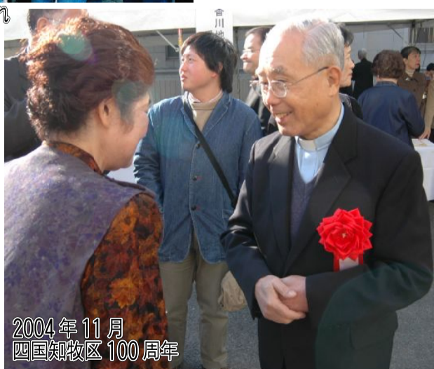
2004年11月 四国知牧区100周年