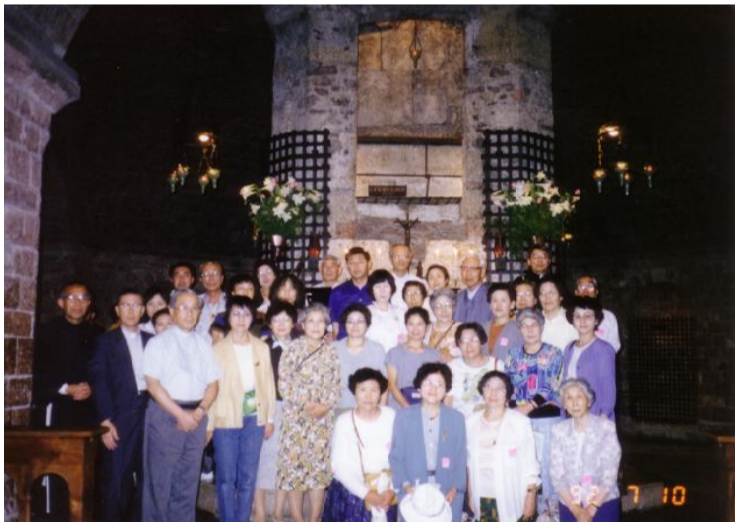
アシジ聖フランシスコ大聖堂にて

司教様お帰りなさい。告別式は愛に満たされた和解の場でありました。主の晩さあ、のようでありました。招かれた一人として賛美と感謝がアのふれ種々のことを想起しました。フランス・イタリイの巡礼のこと、徳島から桜町に転入した時のこと、病弱であっ私にはたくさんのみことばと励ましをいただき、聖歌の席を勧められ、今もこれにとどまっています。典にふさわしい者になりたいと思っています。