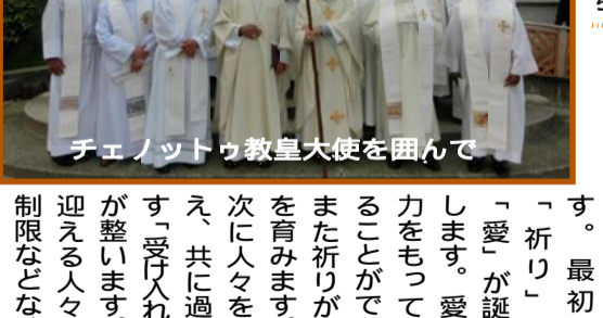
チェノットウ教皇大使を囲んで

教会にやってくる人の全員に共通しているのは「イエス様が一番」という単純かつ正直な心です。この心から教会つまり信徒が生まれてゆきます。最初に「祈り」と「愛」が誕生します。愛の力をもって祈ることができ、また祈りが愛を育みます。次に人々を迎え、共に過ごす「受け入れ」が整います。迎える人々に制限などなく、