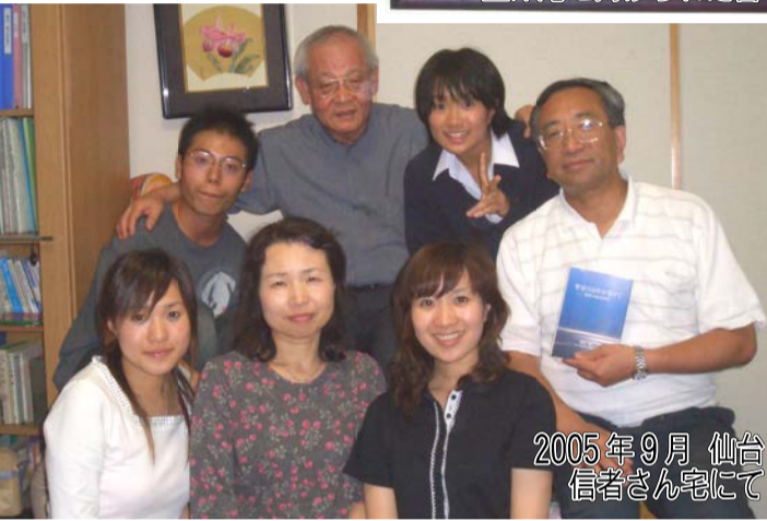
2005年9月 仙台 信者さん宅にて