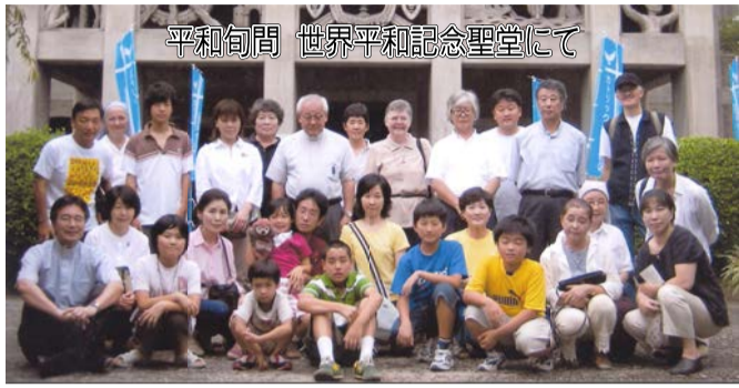
平和旬間 世界平和記念聖堂にて

神の優しさ示された 神さま(御父)の優しさ・いつくしみを目に見える形で示してください。との方：それが私にとっての溝部司教様でした。と同時に、その優しさ・いつくしみに、私が手を抜こうとした場合、父のように厳しく指摘される方でした。そのお方が天国に旅立たれ、悲しみや寂しさの中にあつて、慰められることがあるとしたら、今までは地理的物理