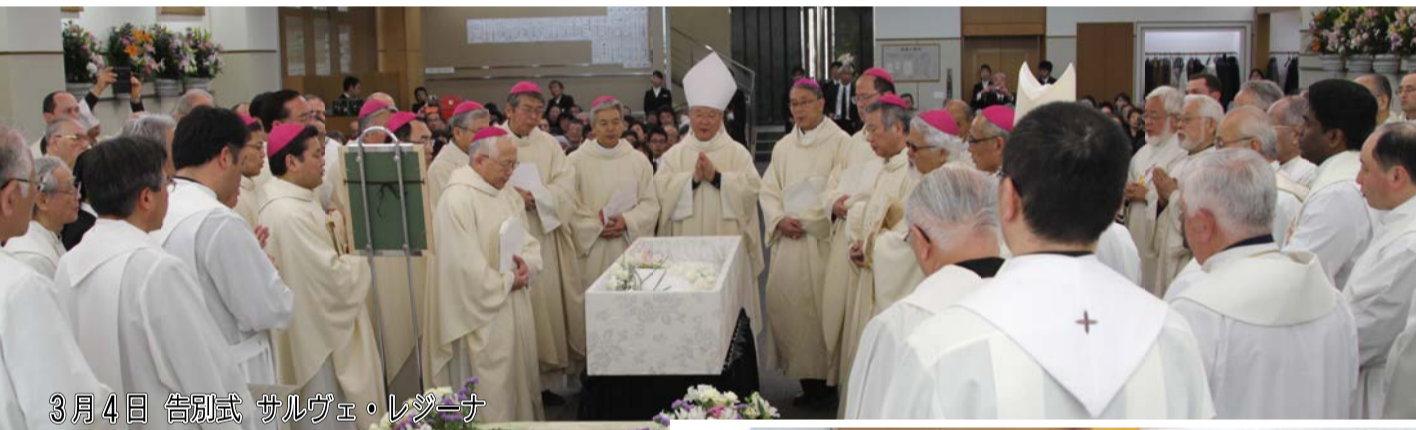
3月4日 告別式 サルヴェ・レジーナ