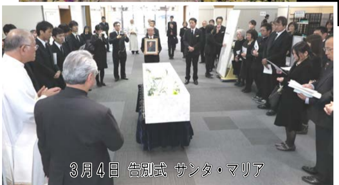
3月4日 告別式 サンタ・マリア