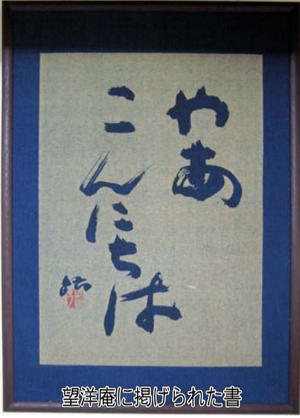
望洋庵に掲げられた書