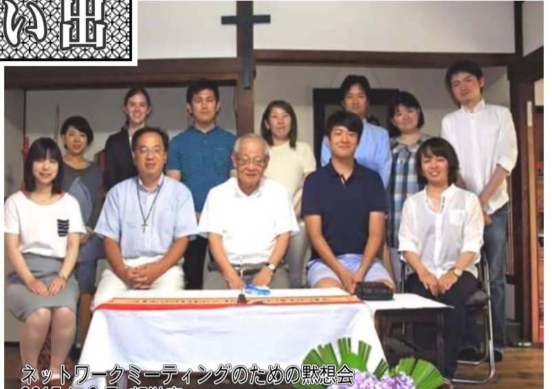
ネットワークミーティングのための黙想会 2015年6月 望洋庵