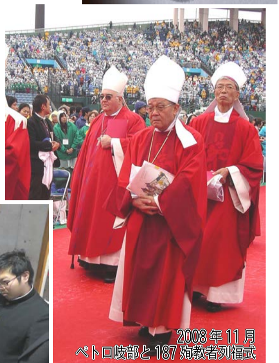
2008年11月 ペトロ岐部と187殉教者列福式