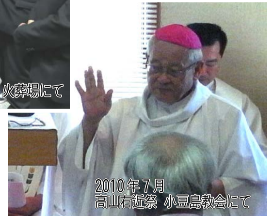
2010年7月 高山右近祭 小豆島教会にて