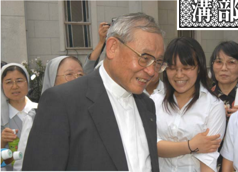
2004年7月 高松教区着座式にて