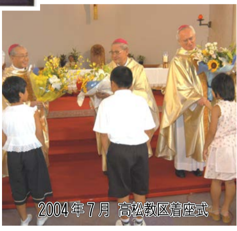
2004年7月 高松教区着座式