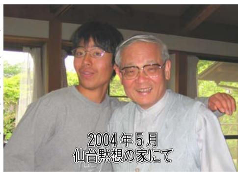
2004年5月 仙台黙想の家にて

神の優しさ示された 神さま(御父)の優しさ・いつくしみを目に見える形で示してください。との方：それが私にとっての溝部司教様でした。と同時に、その優しさ・いつくしみに、私が手を抜こうとした場合、父のように厳しく指摘される方でした。そのお方が天国に旅立たれ、悲しみや寂しさの中にあつて、慰められることがあるとしたら、今までは地理的物理