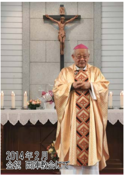
2014年2月 金祝 西庫教会にて