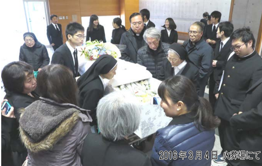
2016年3月4日 火葬場にて