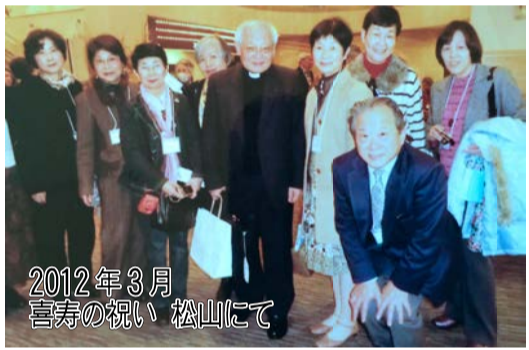
2012年3月 喜寿の祝い 松山にて

司教様は来高時キリシタン武將明石掃部の墓を探訪されとても喜ばれました。日々の生活の中与えられた立場で殉教を生きた生き方をする様にと話された事が心に響いていきます。そしてご自分もそ